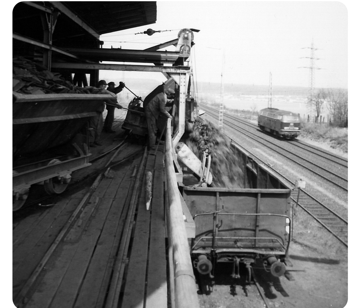
(8) Verladestelle in Großen-Linden 1975; Entladen der Feldbahn-Kippwagen