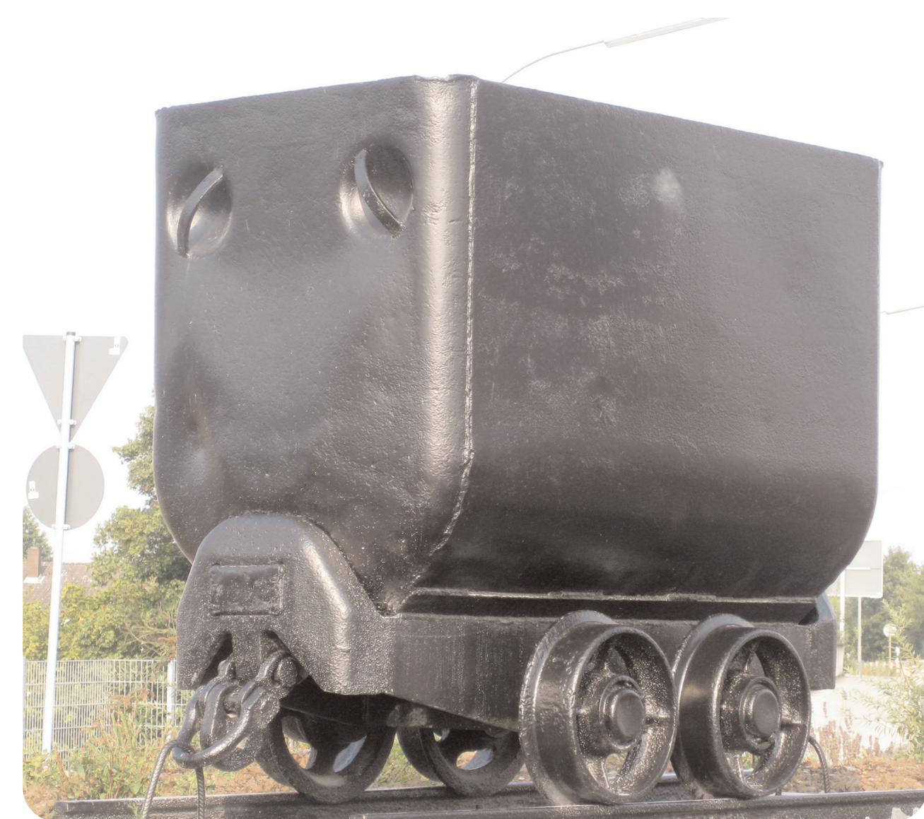
(2) Förderwagen - "Grubenhund"

Der Förderwagen ( ein "Grubenhund", hat keine Kippmulde ) wurde vom Förderverein Besucherbergwerk Fortuna aus einem stillgelegten Bergwerk im Erzgebirge unter Tage geborgen und an die Stadt Linden vermittelt. Dieses vollständig erhaltene und durch die Fachleute des Vereins konservierte Stück (2) war in einem Fördersystem mit maschinelltem "Kreiselwipper" im Einsatz. Zur Entleerung wurden dort die kompletten Förderwagen in einer Art Trommel voll automatisch umgedreht was die Förderkosten erheblich senkte. Dieser Förderwagentyp war auch im Erzbergbau des ehemaligen Dillkreises und des Siegerlandes eingesetzt. - In den Gießener Braunsteinbergwerken am Unterhof, in Großen-Linden am Alfredschacht und im Tagebau Feldwiesen war dieser Typ nicht in Gebrauch. Unser Bergwerk verfügte ausschließlich über Kipploren, deren Mulde schräge Seitenwände aufwies und zur Entleerung seitlich gekippt werden konnte. Dazu musste ein Mechanismus von Hand ausgelöst werden.