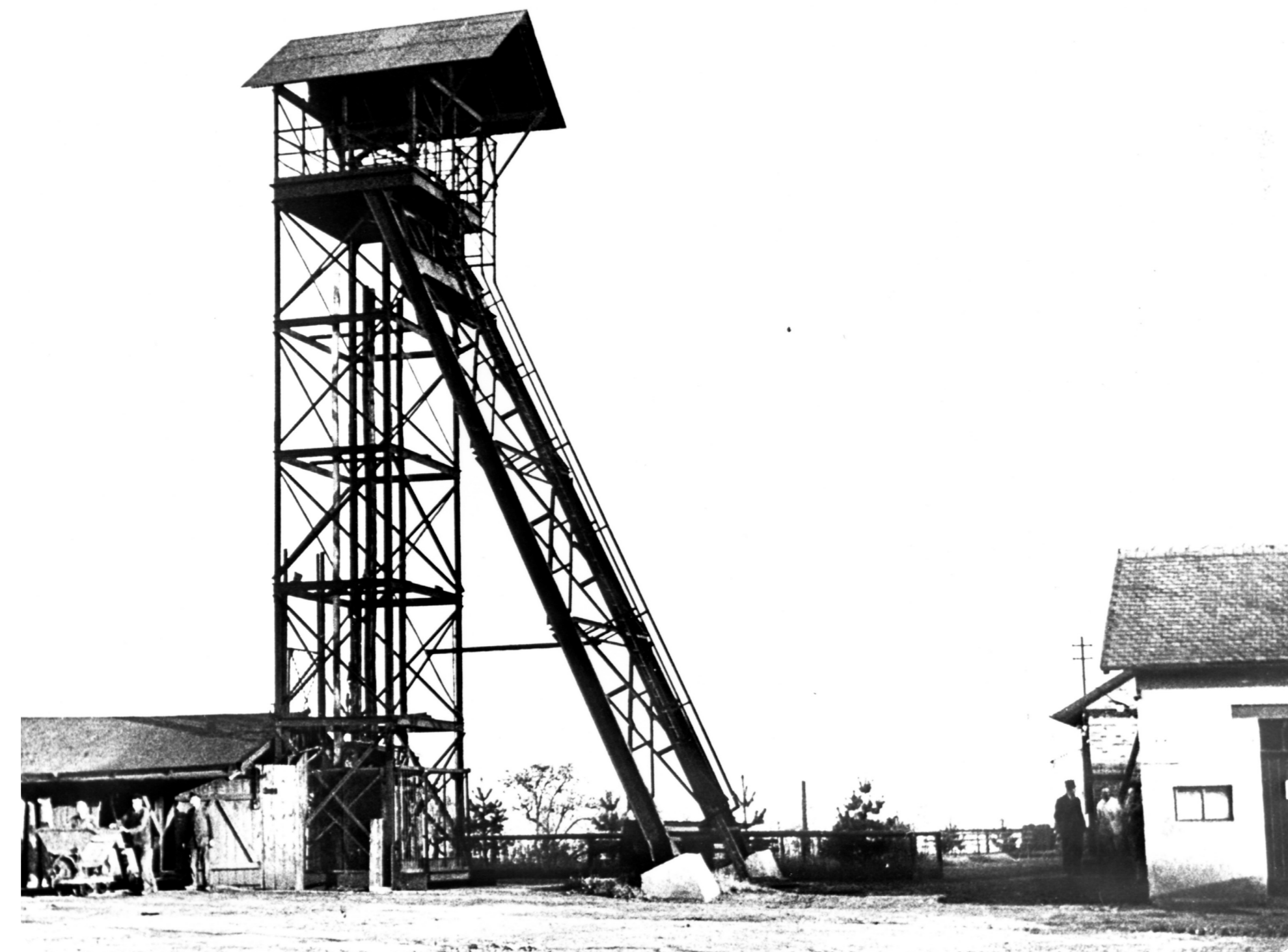
(4) Förderanlage Alfredschacht 1937; rechts das Maschinenhaus ("Haspelhaus" - heute Gießener Pforte 48)