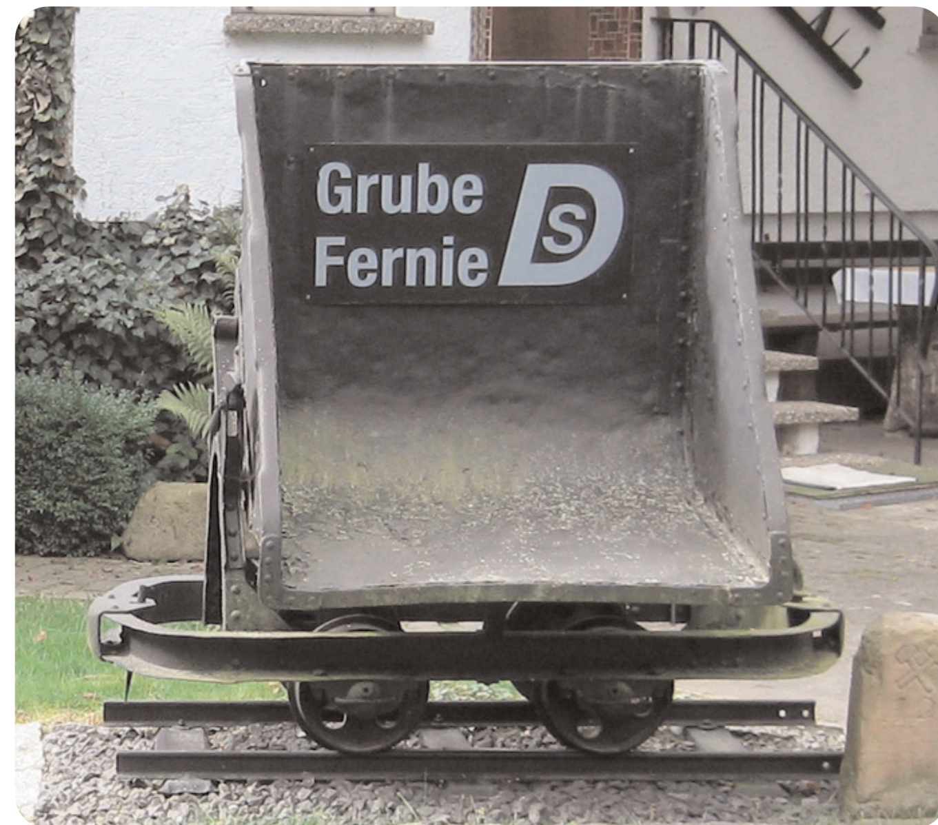
(3) Kipplore des Typs, wie er in der "Grube Fernie" eingesetzt war.

Dieter Schlosser hat eine solche Kipplore (3) aus dem Tagebau Feldwiesen, heute See "Grube Fernie", auf seinem Grundstück am Südrand des Sees aufgestellt.