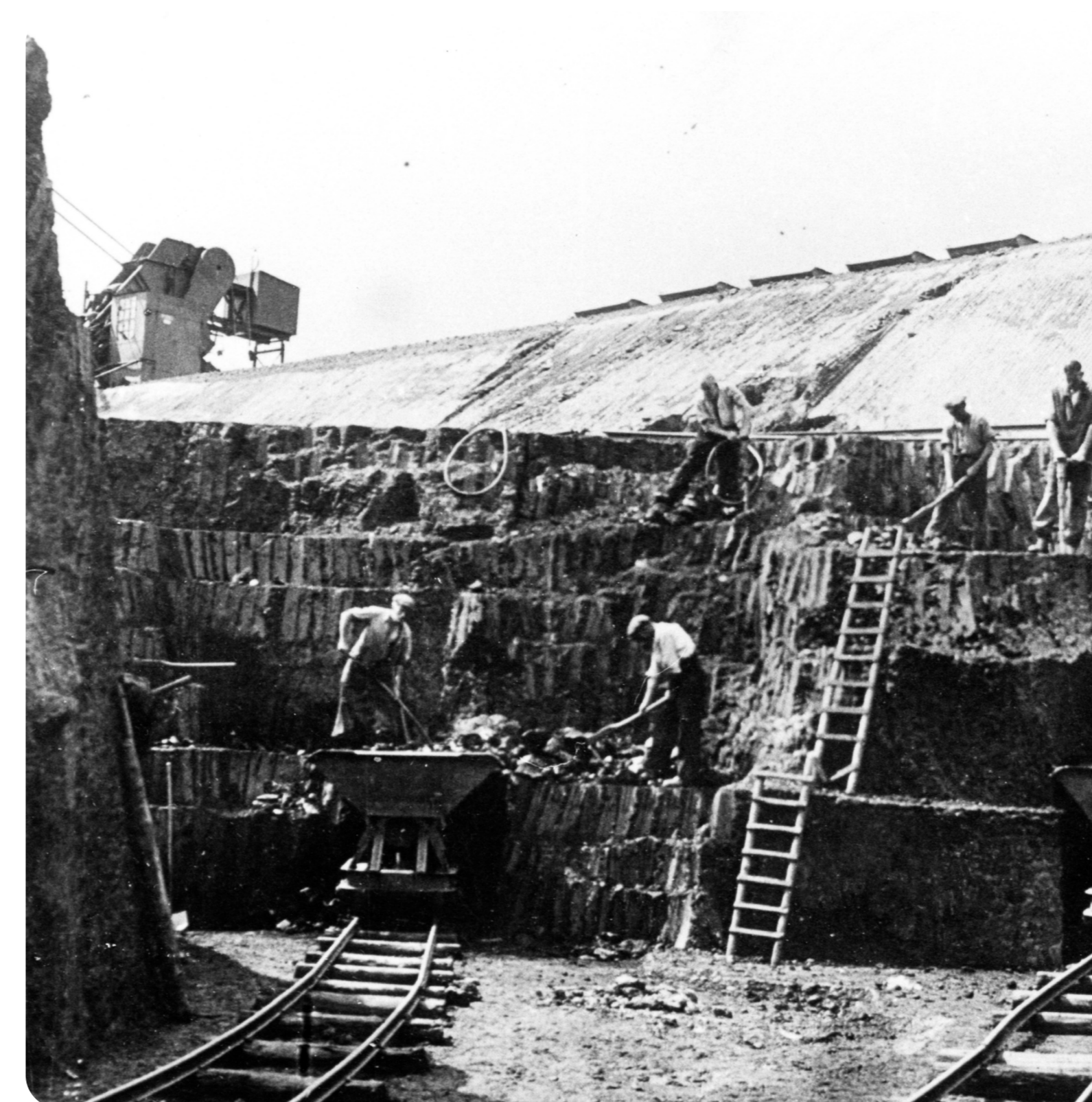
(6) Tagebau Feldwiesen 1938; Abbau auf "Strossen" mit Pressluftspaten; oben links: Abraumbagger