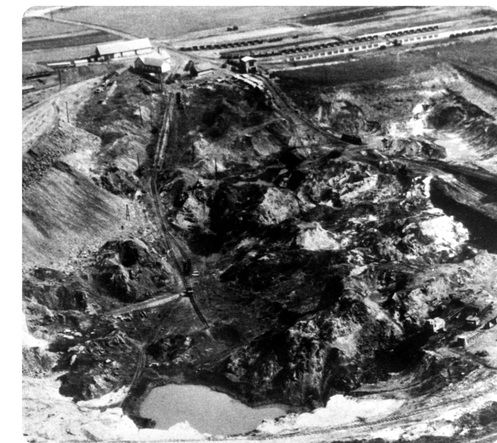
(7) Tagebau Feldwiesen 1952; oben: Zechengebäude, heute Grillgebäude und Clubhaus TC